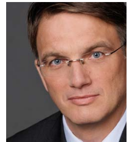
Uwe Fröhlich Präsident des Bundesverbandes der Deutschen Volksbanken und Raiffeisenbanken – BVR

Mitglied des Kuratoriums Aktive Bürgerschaft e.V.