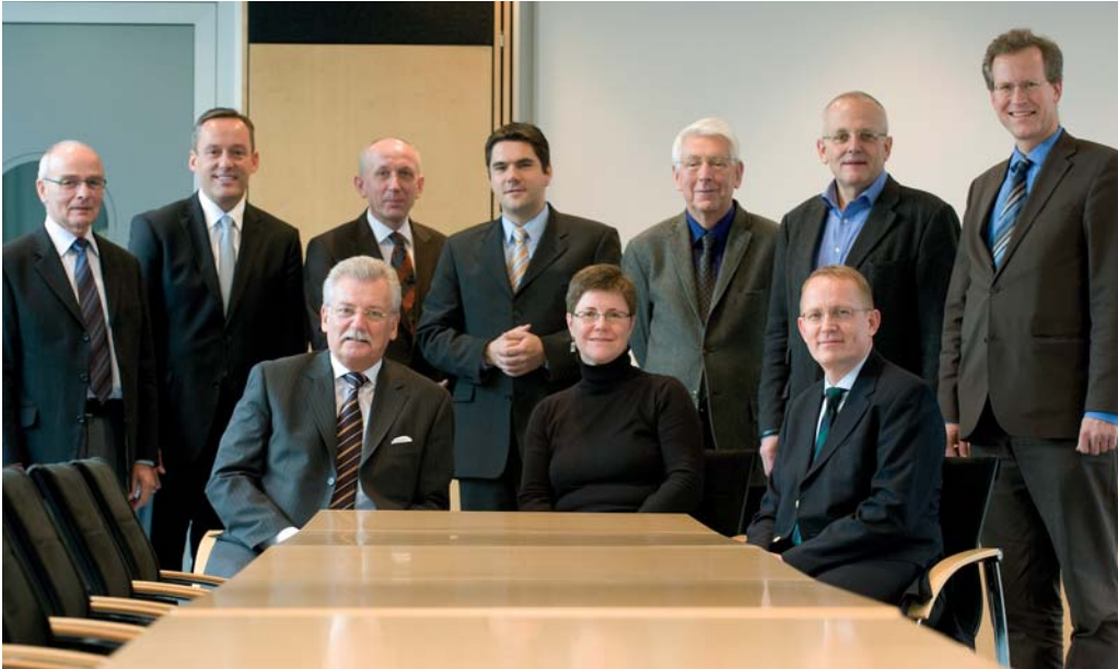
Jurymitglieder des Förderpreises Aktive Bürgerschaft 2011