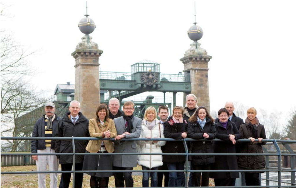
Gut für die Region: Die Bürgerstiftung und ihre Partnerstiftungen

Land. Die Willi und Heti Schreckenbergs Stiftung zum Beispiel unterstützt gemeinnützige Vorhaben für Behinderte und Kranke in Datteln, aber auch ein Projekt in Peru. Ein Ärzte- und Schwesternteam aus der Region führt dort jedes Jahr ehrenamtlich Operationen durch. Für die Partnerstiftungen ist die Bürgerstiftung ein kostenloser Dienstleister. Sie verwaltet das Vermögen und erledigt die Steuern. Gemeinsam führen Bürger- und Partnerstiftung Spendenübergaben und Fundraisingmaßnahmen durch. Beide Seiten profitieren von der Zusammenarbeit durch die öffentliche Aufmerksamkeit.