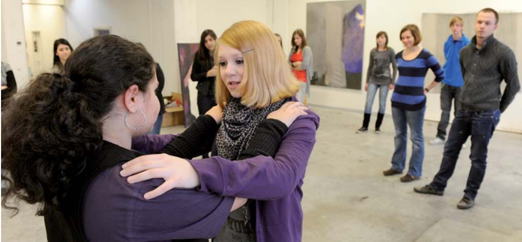
Bei den Proben zum Theaterprojekt „Wir! Helden“