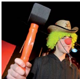
Ein Klinikclown – einer von „Arnsbergs Helden“