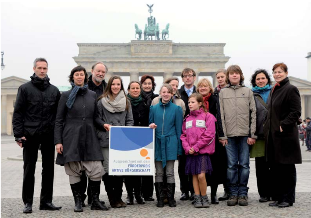
Die Bürgerstiftung Barnim Uckermark vor dem Brandenburger Tor in Berlin

Engagierte der Bürgerstiftung EmscherLippe-Land bei der Preisübergabe durch Bundesumweltminister Dr. Norbert Röttgen (rechts).