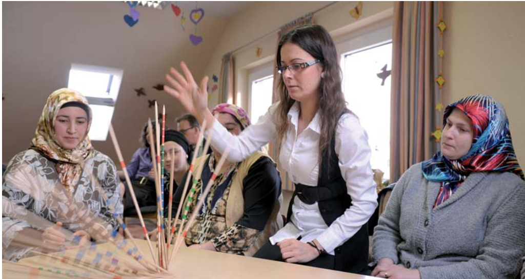
Stärkt türkische Eltern – Das Integrationslotsenprojekt der Bürgerstiftung Bad Essen