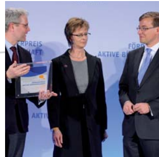
Die Initiatoren von „Wir! Helden“ der Bürgerstiftung Arnberg (links)

Engagierte der Bürgerstiftung EmscherLippe-Land bei der Preisübergabe durch Bundesumweltminister Dr. Norbert Röttgen (rechts).