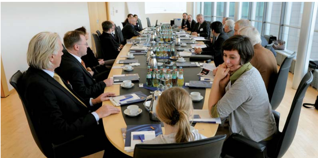
Jurysitzung des Förderpreises Aktive Bürgerschaft 2011: Die Jury gemeinsam mit allen Finalisten