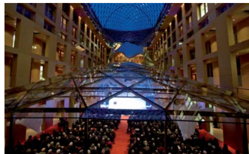
Veranstaltungsort: Forum der DZ BANK am Pariser Platz in Berlin (rechts)