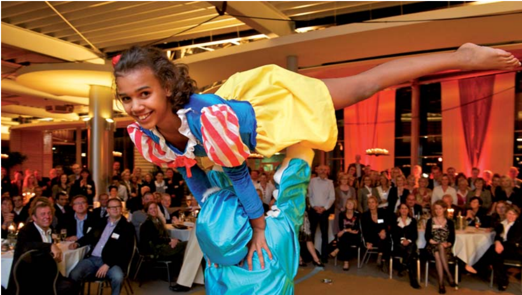
Künstler aus der Region bei der „Bürgerparty 2010“

Bürgerstiftung lokale Bands, Theatergruppen und Akteure wie die mehrfach preisgekrönten Showakrobaten gewinnen. Diese wiederum verzichteten allesamt auf ihre Gage. Mit dem bunten Abendprogramm mit Künstlern aus der Region gelang es der Bürgerstiftung Vechta, verschiedene Zielgruppen anzusprechen.