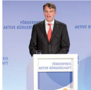
Die BürgerStiftung Arnsberg, die Bürgerstiftung Vechta und Uwe Fröhlich

Uwe Fröhlich, Mitglied des Kuratoriums der Aktiven Bürgerschaft und Präsident des Bundesverbandes der Deutschen Volksbanken und Raiffeisenbanken, hielt die Laudatio auf die Bürgerstiftungen Arnsberg, EmscherLippe-Land und Vechta (Auszüge).