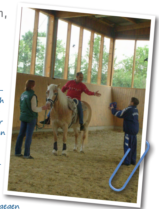
Die Reitgruppe des sozialgenial-Schulprojekts beim Ballspiel.

In der Zeit habe ich viel über Menschen mit Behinderungen gelernt und bin froh, dieses Thema für mein Engagement gewählt zu haben. Es fiel mir schwer, am Ende der Zeit von der Gruppe Abschied zu nehmen, da alle immer nett und lustig waren.