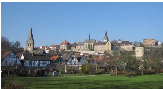
Stadtpanorama von Warburg

Weitere Informationen www.buergerstiftung-warburg.de