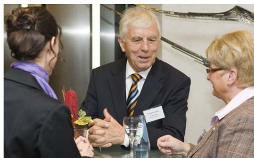
Impressionen vom Regionalforum Bürgerstiftungen West des Jahres 2010