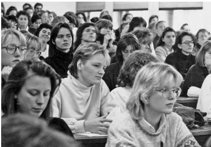
Besucherinnen des 1. Münchner-Mädchen-Technik-Tag am 10. März 1990